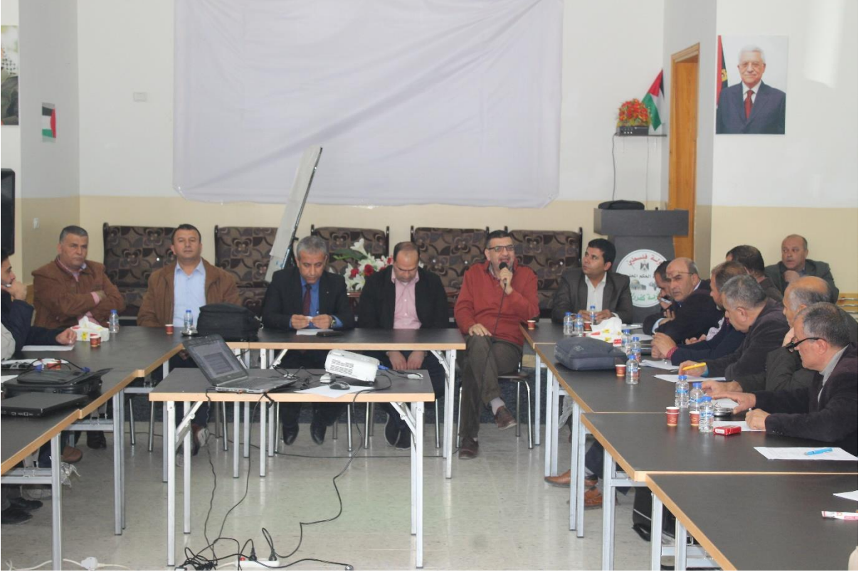
ملحق 5: صور ورشة العمل الأولى